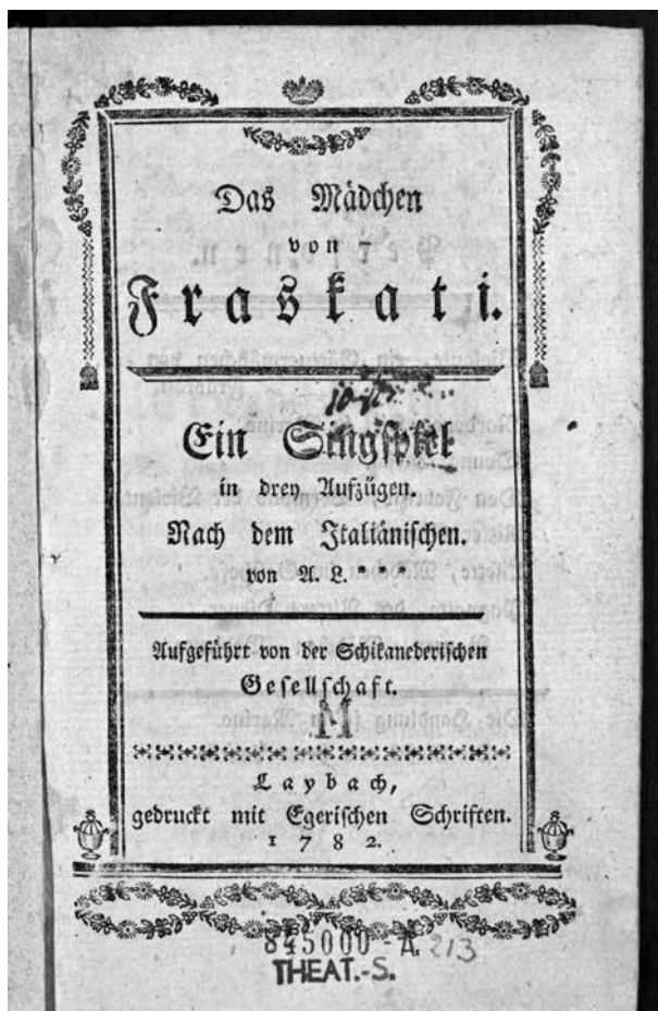
Slika 1: Naslovnica libreta Das Mädchen von Fraskati (Ljubljana: Eger, 1782), ki ga hrani Avstrijska narodna knjižnica na Dunaju. Objavljeno z dovoljenjem Avstrijske narodne knjižnice.

Primerjava tega in ljubljanskega libreta je razkrila, da se že na prvi pogled razlikujeta po obliki in vsebini. Poleg naslovnice to nazorno kažeta različni obseg obeh knjižic (različno število strani) ter zapis imen v seznamu navedenih vlog. Nadaljnje razlike so pri prevodu in v dramaturgiji gledališke produkcije. Nedvomno gre za dva različna prevoda izvirnega italijanskega besedila. Ta ugotovitev je odprla nadaljnje vprašanje o drugem prevajalcu, saj je bilo obema libretoma v katalogu dunajske knjižnice doslej napačno pripisano isto ime – J. F. Schmid. To ime je zapisano s svinčnikom v zgornjem kotu na prvi strani Egerjevega natisa. Sklepamo lahko, da je bila napačna identifikacija imena prevajalca za ljubljanski libreto posledica površnega pregleda (in zapisa) neznanega knjižničarja. Že zapis na naslovnici libreta Nach dem italiänischen. / von A. L. *** vzbuja dvom v pravilnost s svinčnikom zapisanega imena prevajalca