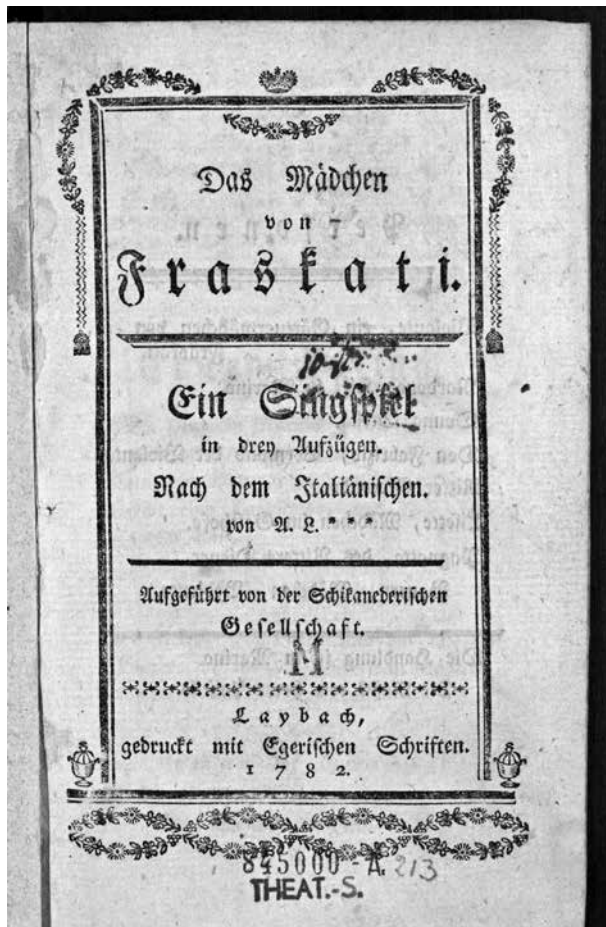
Slika 1: Naslovnica libreta Das Mädchen von Fraskati (Ljubljana: Eger, 1782), ki ga hrani Avstrijska narodna knjižnica na Dunaju.

Primerjava tega in ljubljanskega libreta je razkrila, da se že na prvi pogled razlikujeta po obliki in vsebini. Poleg naslovnice to nazorno kažeta različni obseg obeh knjižic (različno število strani) ter zapis imen v seznamu navedenih vlog. Nadaljnje razlike so pri prevodu in v dramaturgiji gledališke produkcije. Nedvomno gre za dva različna prevoda izvirnega italijanskega besedila. Ta ugotovitev je odprla nadaljnje vprašanje o drugem prevajalcu, saj je bilo obema libretoma v katalogu dunajske knjižnice doslej napačno pripisano isto ime – J. F. Schmid. To ime je zapisano s svinčnikom v zgornjem kotu na prvi strani Egerjevega natisa. Sklepamo lahko, da je bila napačna identifikacija imena prevajalca za ljubljanski libreto posledica površnega pregleda (in zapisa) neznanega knjižničarja. Že zapis na naslovnici libreta Nach dem italiänischen. / von A. L. *** vzbuja dvom v pravilnost s svinčnikom zapisanega imena prevajalca