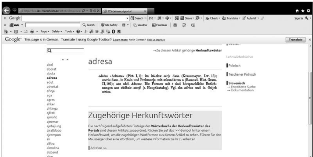
Slika 1: Ponazoritev vmesniške podobe pri iskanju prek seznama iztočnic (na spletu).