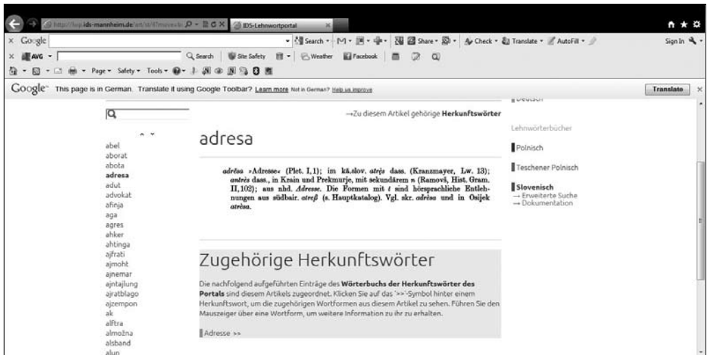
Slika 1: Ponazoritev vmesniške podobe pri iskanju prek seznama iztočnic (na spletu).