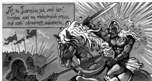
Slika 2: MATĚJÍČEK 2007: 3. Prevod besedila v oblačkih: Ah, tu Jaroslav leti kot orel, s trdim jeklom na mogočnih prsih, pod jeklom hrabrost, odločenost.

Šifra mistra Hanky se začneja z enostranskim prikazom nedoločene pustolovske zgodbe. Slog risb na prvi pogled spominja na stripe junaškega tipa; na risbah prevladuje prikazovanje bojev. S tem pustolovskim uvodom je prikazano spoštovanje osnovnega pravila stripovskega žanra – prevlada akcijskih in interakcijskih motivov. 9 Bralec je takoj vržen v dogajanje, ne da bi vedel, za kakšno zgodbo gre.