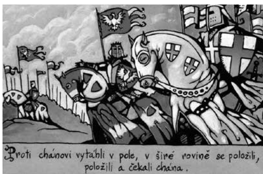
Slika 4: MATĚJÍČEK 2007: 7. Prevod besedila v oblačkih: Proti kanu so se odpravili na polje, po širni ravnini so se postavili in čakali na kana.

Stripovske ilustracije v obdelavi pesmi Jaroslav podpirajo, poživljajo in povečujejo dinamiko besedila in so predvsem demonstrativne, ilustrativne in dopolnjevalne. Besedilo pesmi je razčlenjeno na različno dolge dele, uporabljeno pa je kot vsebina posameznih oblačkov v stripu. Spekter barv v stripovski obdelavi pesmi Jaroslav se ujema z dogajalno linijo – prevladujejo odtenki modre barve (tudi v okvirih z besedilom), skupaj z rdečo (kri, barva zastav) in rumeno barvo (prah v nevihti in pri jahanju na konjih, sončna svetloba, ogenj). Tako omejen barvni spekter učinkovito prikliče temačno, grobo, bojevito in sovražno vzdušje. Značilnosti risb pustolovskih stripov so ohranjene tudi v upodobitvi lepe Kublajevne (v pesmi je opisana kot oseba, ki je »oblečena vsa v zlat brokat, vrat in prsi imela je odkrite, z biseri in dragimi kamni ovenčana« – str. 6). Zvest prenos tega besednega opisa v vizualno podobo delno pomika žanr pustolovskega in zgodovinskega stripa na področje erotičnih stripov.