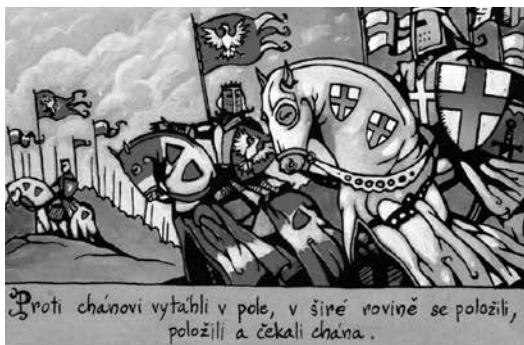
Slika 4: MATĚJÍČEK 2007: 7. Prevod besedila v oblačkih: Proti kanu so se odpravili na polje, po širni ravnini so se postavili in čakali na kana.

Stripovske ilustracije v obdelavi pesmi Jaroslav podpirajo, poživljajo in povečujejo dinamiko besedila in so predvsem demonstrativne, ilustrativne in dopolnjevalne. Besedilo pesmi je razčlenjeno na različno dolge dele, uporabljeno pa je kot vsebina posameznih oblačkov v stripu. Spekter barv v stripovski obdelavi pesmi Jaroslav se ujema z dogajalno linijo – prevladujejo odtenki modre barve (tudi v okvirih z besedilom), skupaj z rdečo (kri, barva zastav) in rumeno barvo (prah v nevihti in pri jahanju na konjih, sončna svetloba, ogenj). Tako omejen barvni spekter učinkovito prikliče temačno, grobo, bojovito in sovražno vzdušje. Značilnosti risb pustolovskih stripov so ohranjene tudi v upodobitvi lepe Kublajevne (v pesmi je opisana kot oseba, ki je »oblečena vsa v zlat brokat, vrat in prsi imela je odkrite, z biseri in dragimi kamni ovenčana« – str. 6). Zvest prenos tega besednega opisa v vizualno podobo delno pomika žanr pustolovskega in zgodovinskega stripa na področje erotičnih stripov.