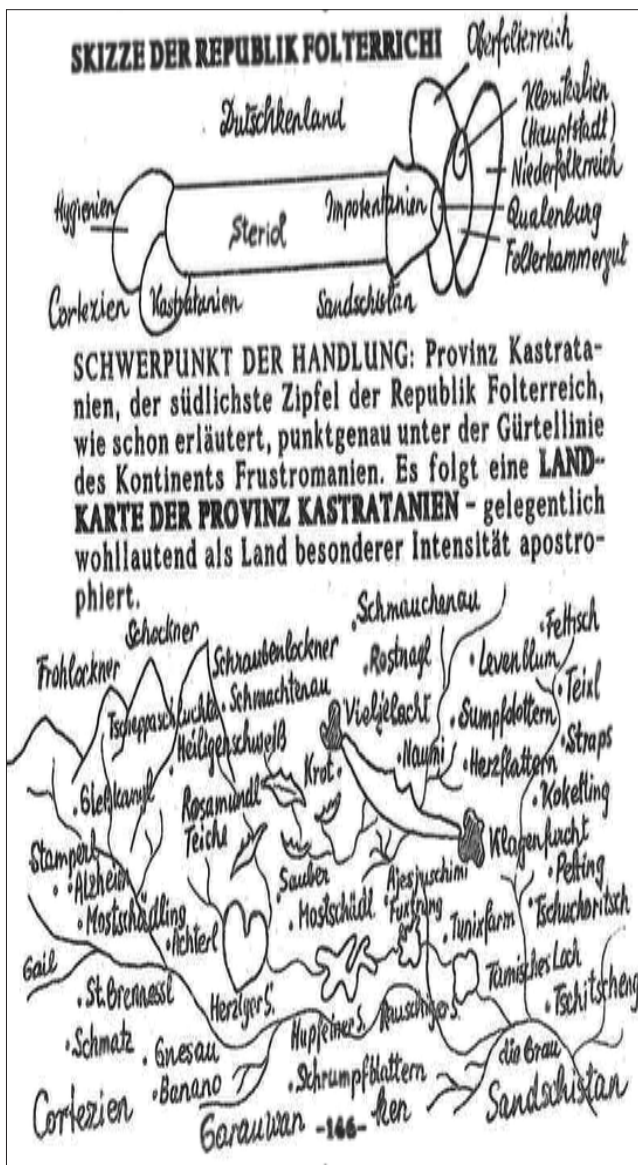
Slika 1: Iz knjige Miriam Schöfman (= Kristijan Močilnik), Waches Schwester , 1999: 146.

videz bežne računalniške izdelave knjižnega izdelka, ki sicer nima ne letnice izdaje ne impresuma.