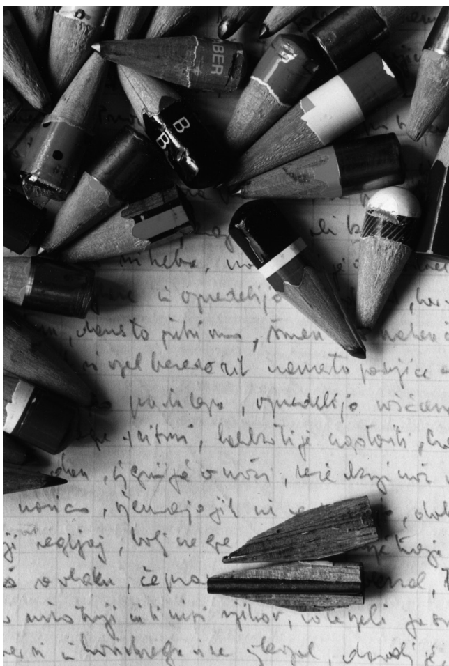
Slika 2: Štrclji svinčnikov Florjana Lipuša; Robert Musil-Institut für Literaturforschung/Kärntner Literaturarchiv.

Za poezijo Fabjana Hafnerja, enega izmed najbolj plodnih avtorjev v sistemu slovenske književnosti v Avstriji (Bandelj 2008: 164), kar velja tudi za njegov prevajalski opus, je značilno, da avtor »neutrudno otipava prostore jezika« (Hafner 2001: 171). Pisanje in prevajalsko delo se medsebojno prepletata, pri čemer pisanje poezije črpa